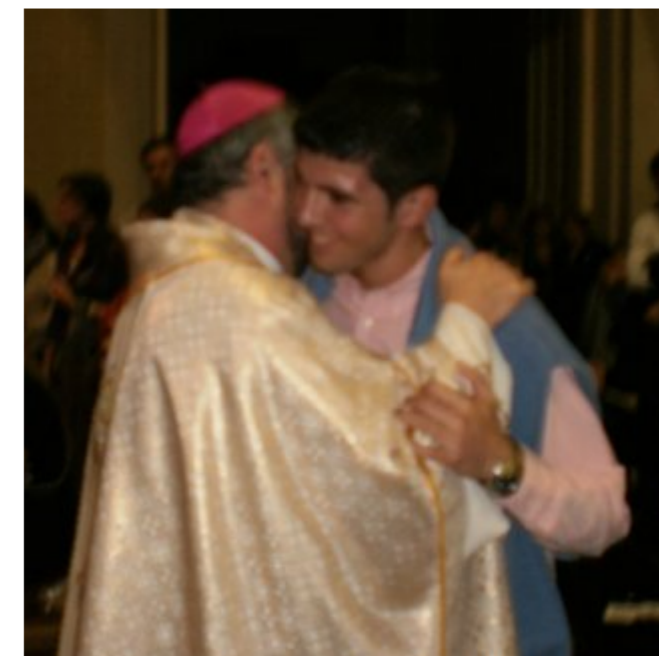
Los jóvenes felicitaron personalmente a Don Carlos