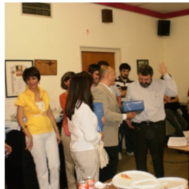
La fiesta de despedida tuvo momentos muy emotivos

Por su parte, un día antes, Sicar le brindó su especial despedida. Primeramente, sobre las 21:00 horas del sábado 18 de septiembre, tuvo lugar una Vigilia de Oración, organizada por el Taller de Espiritualidad. Una vez concluida, en la ya mítica sala 38 de la parroquia, un gran número de jóvenes se reunieron para cenar y despedirse personalmente de él. Algunos regalos a modo de agradecimiento y, sobre todo, varios testimonios muy emotivos pusieron fin a una jornada un tanto agri dulce: dulce por la alegría de ver a nuestro párroco en este importante nuevo servicio a la Iglesia, pero también un poco amargo porque, para ello, tiene que dejar la que ha sido su parroquia durante los últimos dos años.