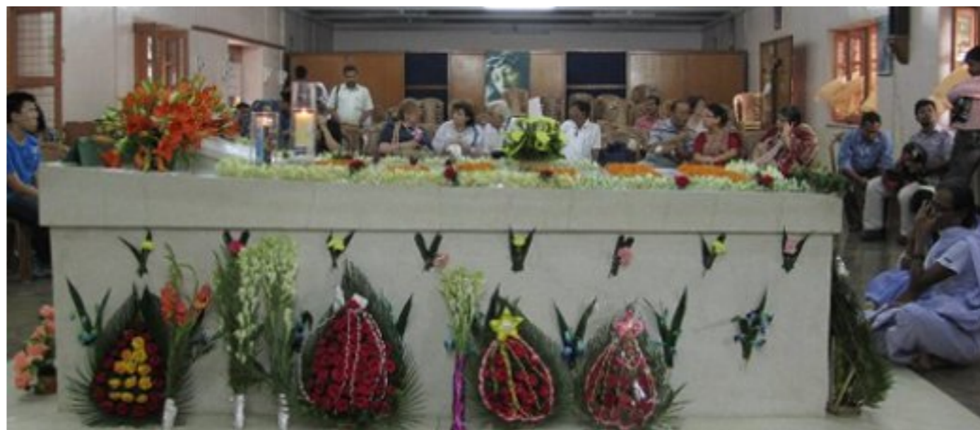
La tumba de la Madre Teresa de Calcuta el 26 de agosto de 2010, día en el que se cumplieron 100 años de su nacimiento