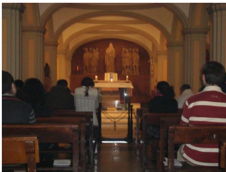
Los jóvenes de Sicar en la Adoración Eucarística del pasado 21 de febrero en la Cripta de nuestra Parroquia.

Que cada día que pase, los jóvenes estemos más unidos en Cristo, y que encontremos mediante el Papa en Madrid lo que cada uno de nosotros necesitamos encontrar para crecer y seguir adelante en este camino que es el camino del amor fraterno, que es el camino de la vida, que es el camino de la Verdad.