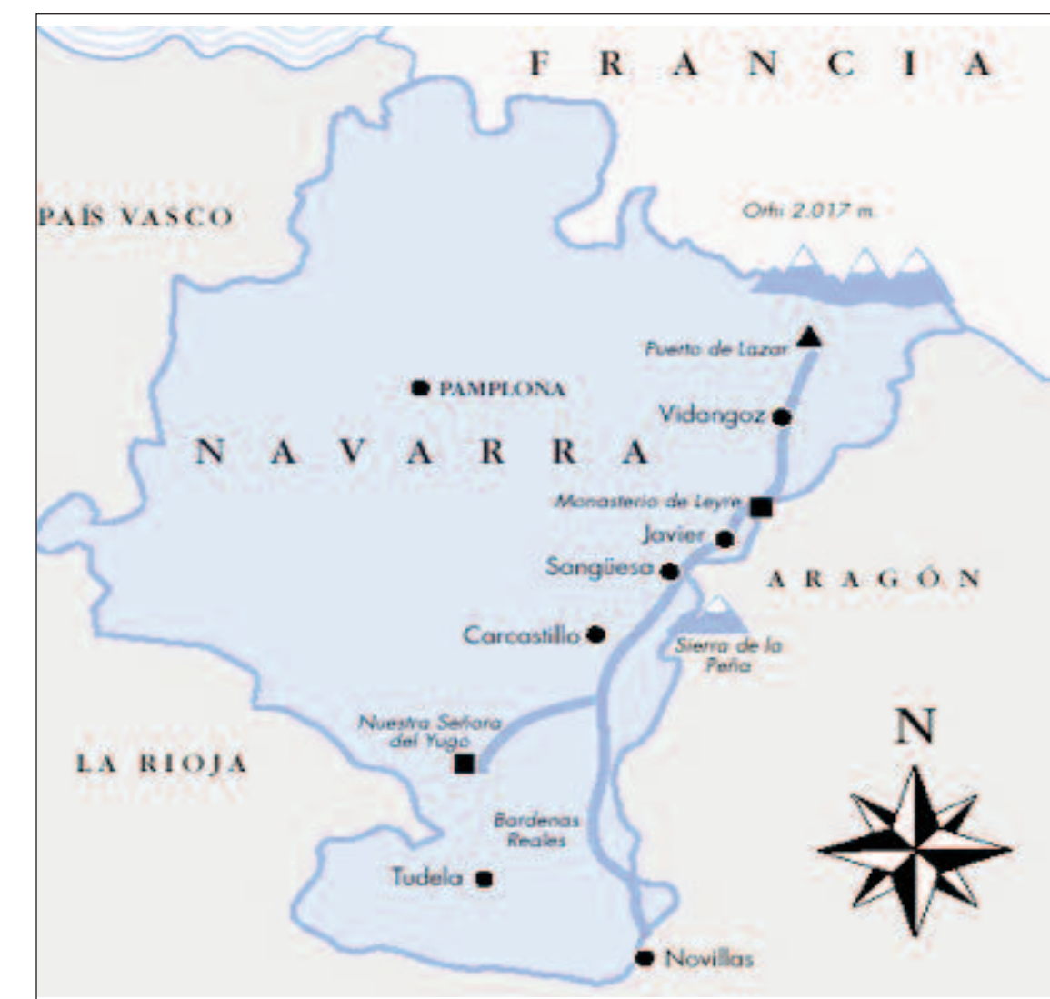
Desde Sangüesa a Javier se realiza un viacrucis penitencial