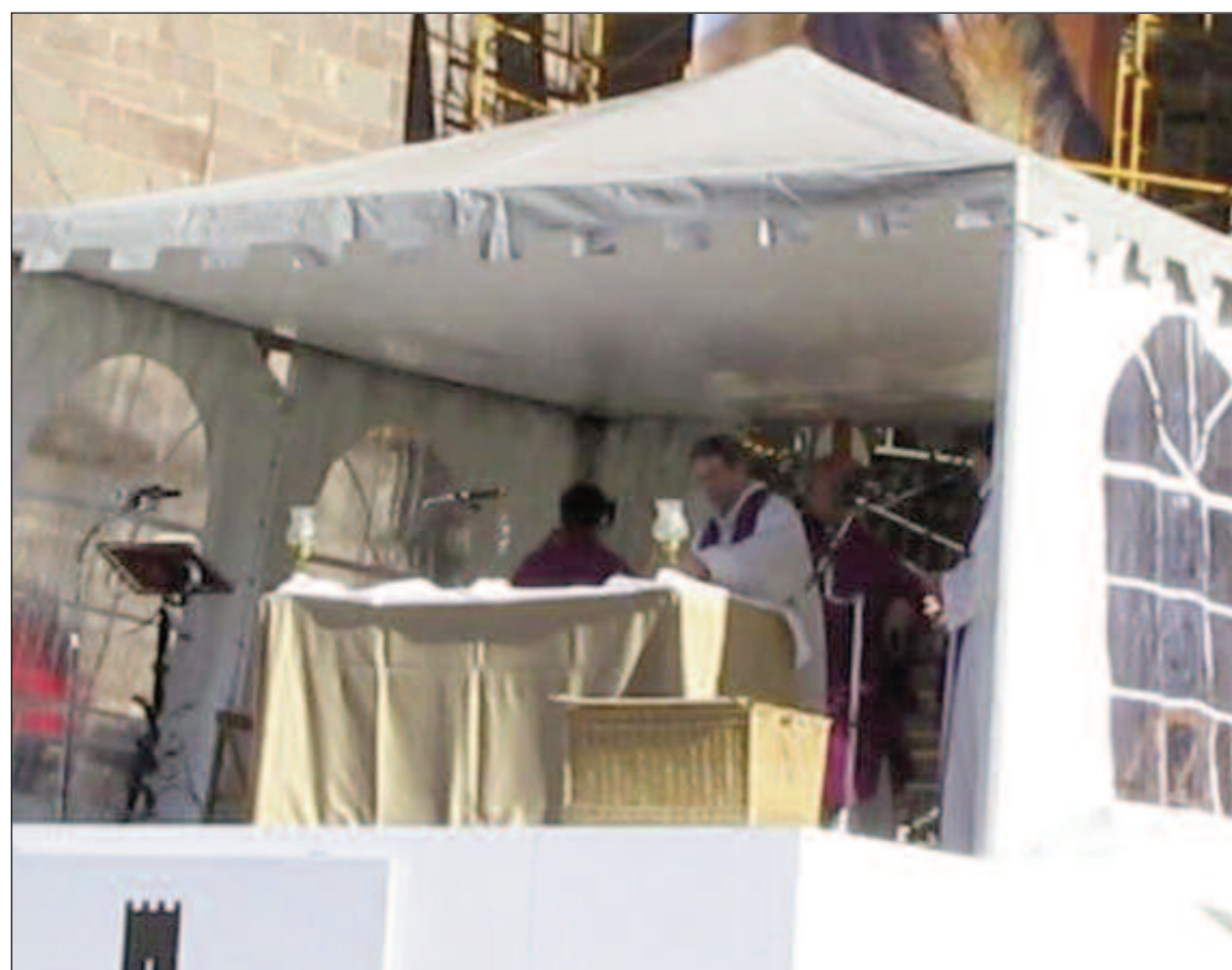
Un momento de la oración frente al santísimo