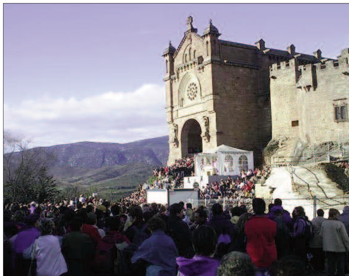
La Javierada congrega a miles de personas de España y del extranjero

Miles de jóvenes emprenden rumbo al Castillo