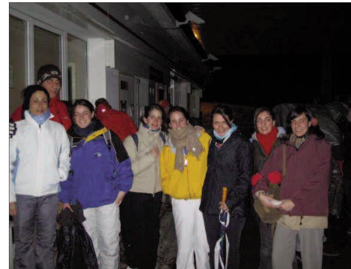
Los autobuses partirán de la sede central de Ibercaja a las seis y media de la mañana

- Llegaremos a Noain en autobús, a las afueras de Pamplona, hacia las 08:30 y sobre las 09:00 empezaremos a caminar hacia Javier, donde llegaremos al atardecer.